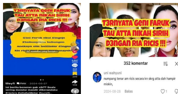
Gambar 3. Pencemaran nama baik pada kolom komentar Tiktok