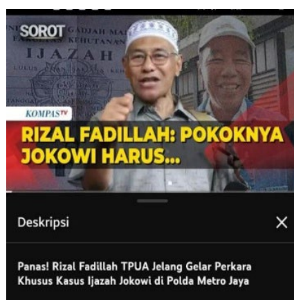
Gambar 4. Provokasi dan hasutan pada kolom komentar YouTube