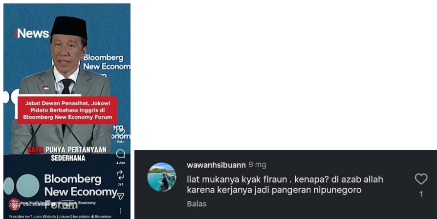
Gambar 2. Ujaran penghinaan pada kolom komentar Tiktok