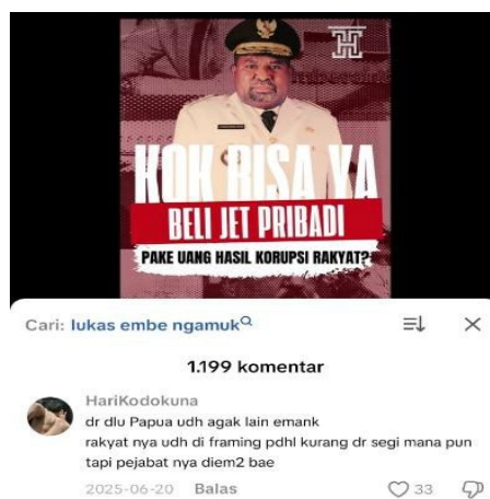
Gambar 1. Ujaran kebencian pada kolom komentar Tiktok